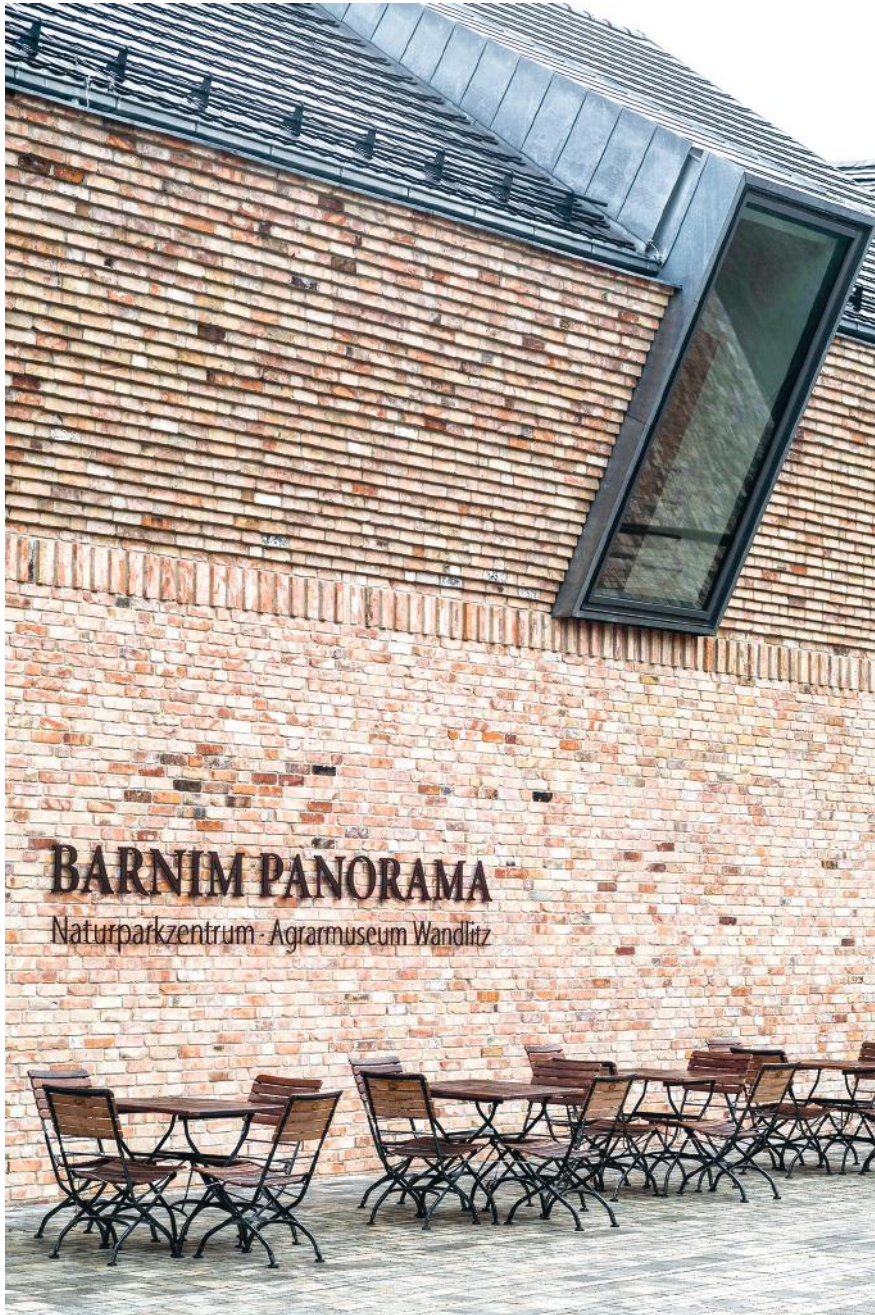
Wandlitz, Barnim Panorama Naturparkzentrum – Agrarmuseum Wandlitz Planung: rw+ Gesellschaft von Architekten mbH