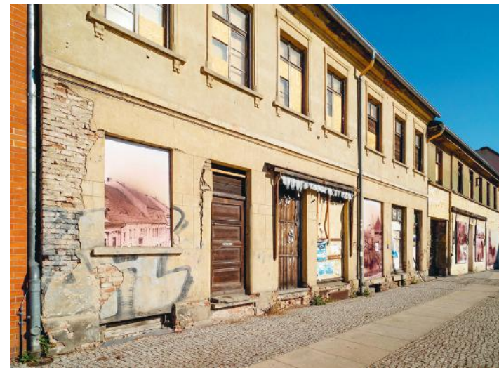
Der „Donut-Effekt“: Leerfallende Ortskerne mit Funktionsverlust...

Wert dieser historisch gewachsenen Zentren sollte deshalb gerade bei der jungen Generation, aber auch bei Familien und privaten Bauherrschaften mit Interesse an einem Eigenheim geweckt und gestärkt werden.