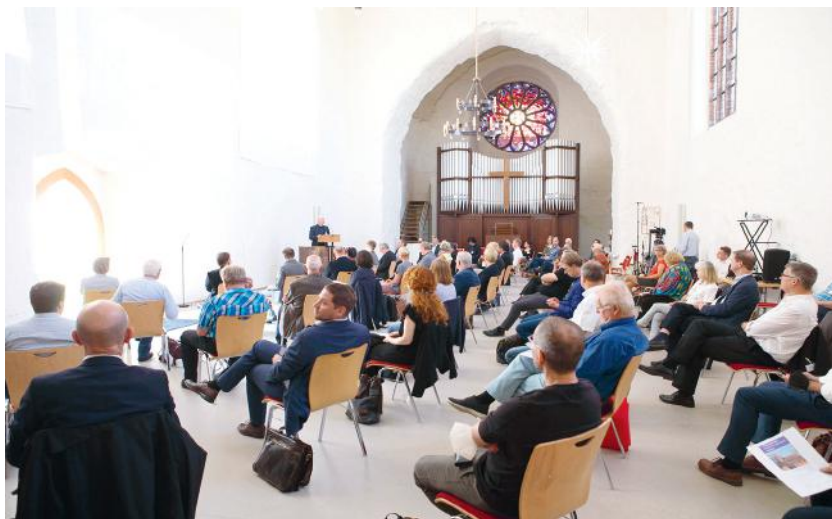
Tagung Dorfkirchen in Prenzlau am 10. September 2021

Die Tagungen des Fördervereins Baukultur Brandenburg richten sich an ein interdisziplinäres Fachpublikum und thematisieren aktuelle Fragestellungen und Herausforderungen der Baukultur in Brandenburg. Im Fokus der Veranstaltungen stehen bauliche und landschaftliche Charakteristika der Baukultur in Brandenburg, ihre Bewahrung und ihre zukünftige Nutzung. In einem Austausch zwischen Akteur:innen aus Politik, Baupraxis und Wissenschaft werden gemeinsam Lösungsvorschläge erarbeitet und veröffentlicht. Gleichzeitig stellen die Tagungen eine wichtige Möglichkeit zur Stärkung des Netzwerks der Baukulturschaffenden in Brandenburg dar.