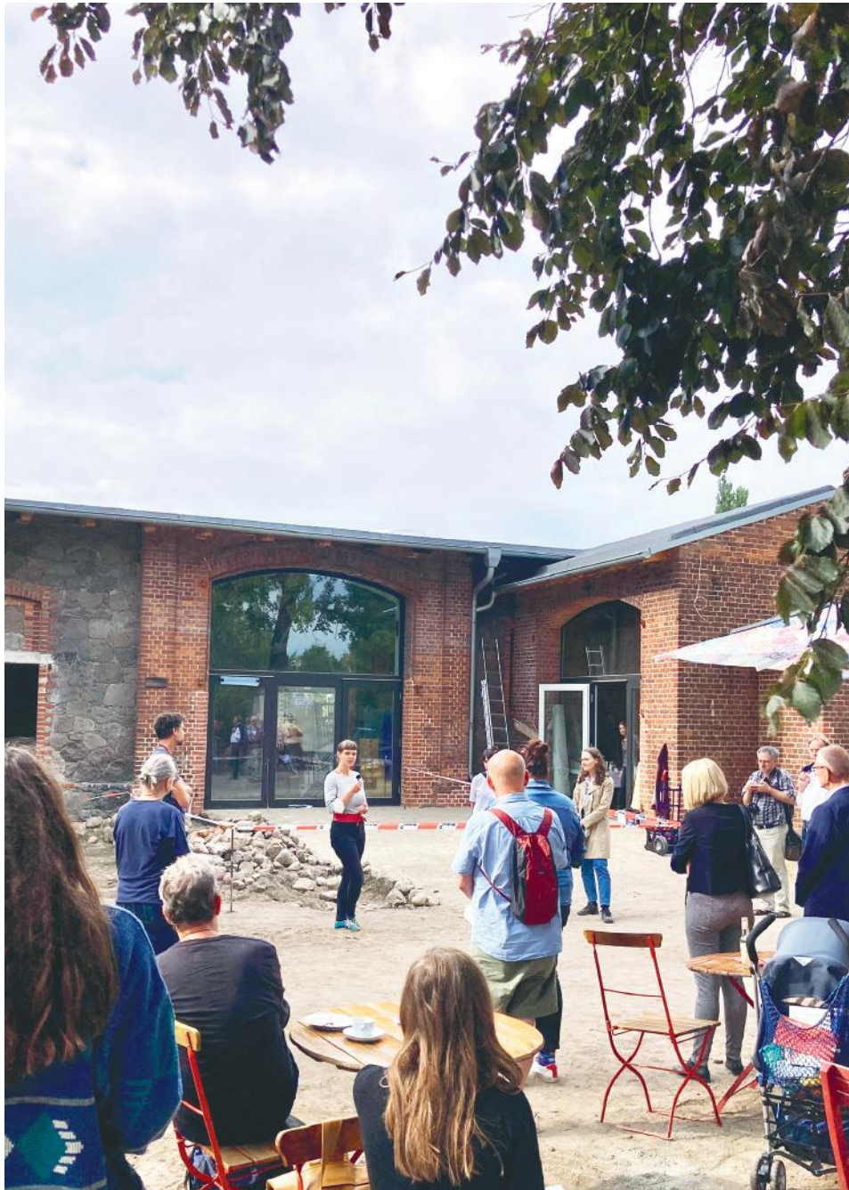
Baukultur Picknick auf dem Hof Prädikow am 20. August 2021