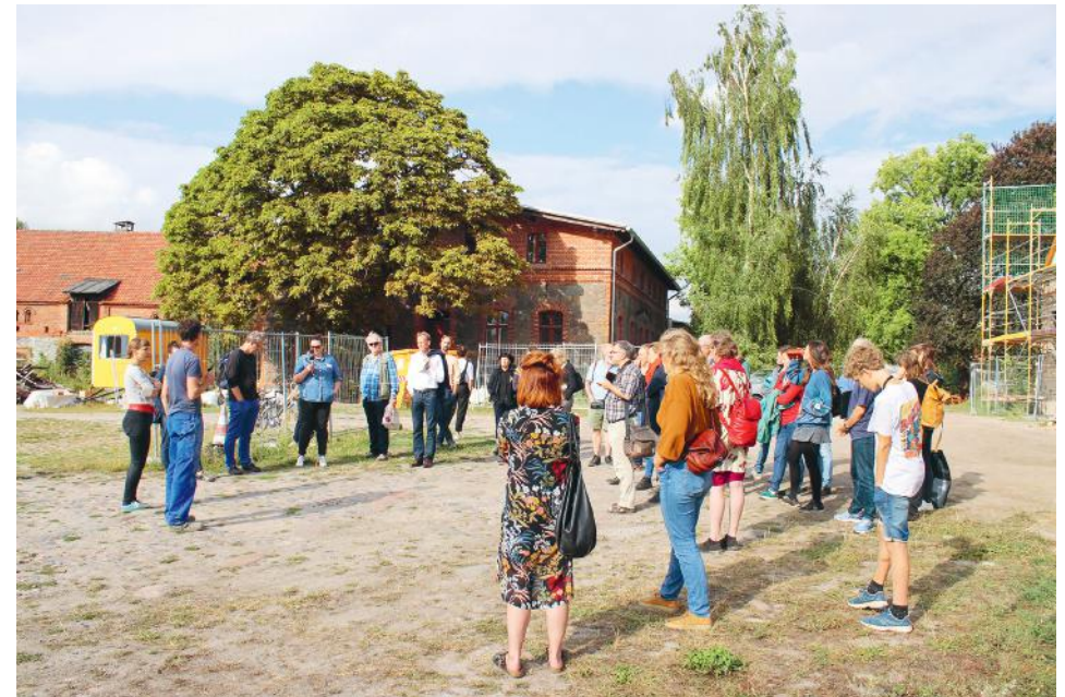
Baukultur Picknick auf dem Hof Prädikow am 20. August 2021

In der Erklärung von Davos formulierten die europäischen Kulturminister:innen im Jahr 2018 Leitsätze für eine hohe Baukultur in Europa. Davon ist auch das Grundverständnis der Baukulturinitiative Brandenburg geprägt. Den Ansprüchen an eine entsprechende baukulturelle Praxis können die Mitwirkenden jedoch nur gerecht werden, wenn auch die wesentlichen Rahmenbedingungen des Landes Brandenburg berücksichtigt werden: das baukulturelle Erbe und die baukulturelle Gegenwart, das Spannungsverhältnis zwischen wachsenden und schrumpfenden Regionen sowie die Struktur des lokalen und regionalen Engagements.