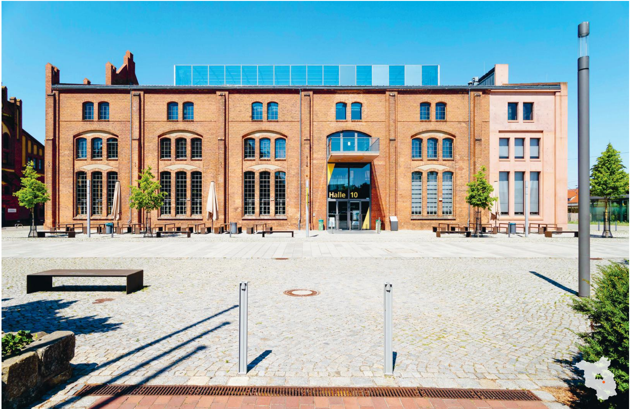
Wildau ehemalige Lokfabrik Schwartzkopff, jetzt TH Wildau Planung Ergänzungsbau: Chestnutt_Niess Architekten PartGmbH BDA