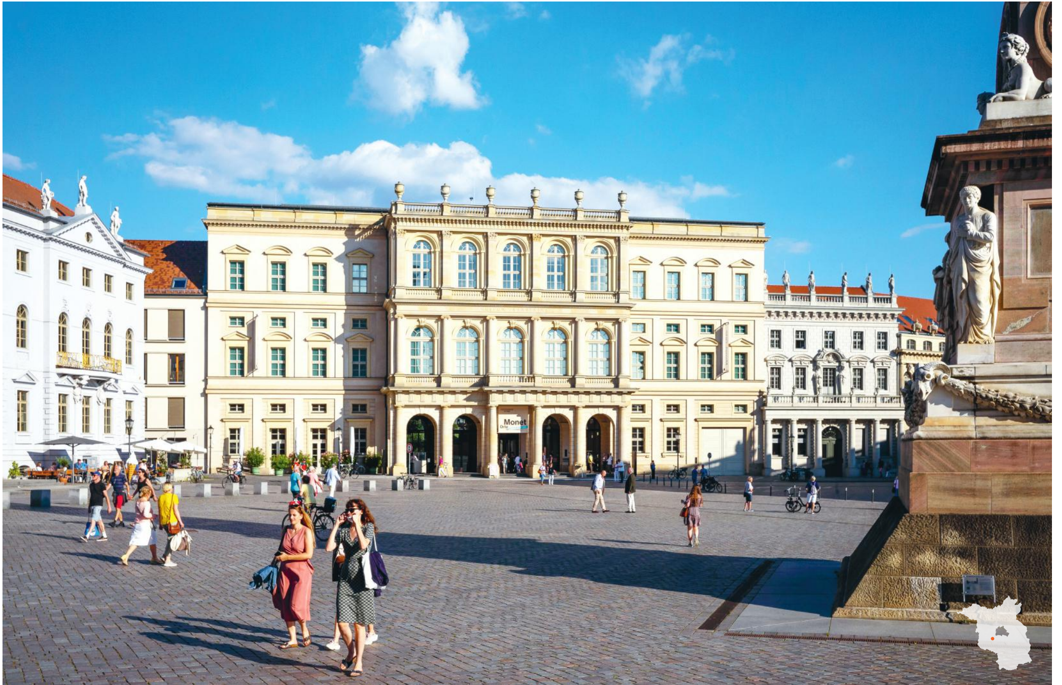
Potsdam Alter Markt