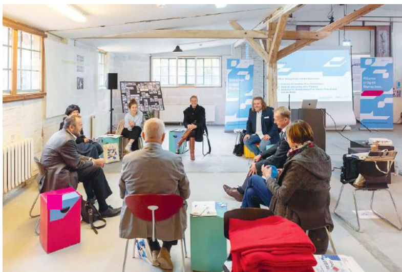
Baukulturdialo g der Bundesstiftung Baukultur in Kooperation mit der Baukulturinitiative Brandenburg in Velt en am 28. Oktober 2020

Für die Baukulturinitiative Brandenburg eröffnet sich durch die räumliche Nähe zur Bundesstiftung Baukultur in Potsdam eine große Spannweite an Möglichkeiten zum unmittelbaren fachlichen und organisatorischen Austausch. Und sie profitiert vor allem von den an diesem Ort konzentrierten, reichen Erfahrungen der Bundesstiftung auf allen Ebenen der Baukultur und der Kommunikation.