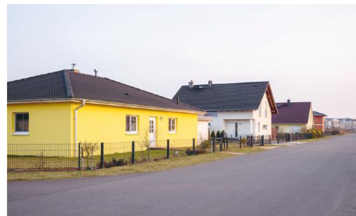
... bei zeitgleichem, stetigem Wachstum von Wohngebieten am Stadtrand.