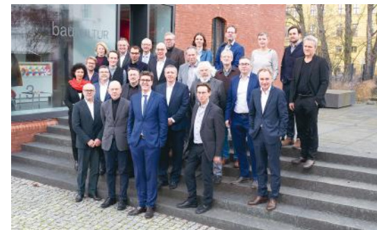
Gründungsversammlung des Fördervereins Baukultur Brandenburg am 18. Februar 2020

Der Förderverein unterstützt und ergänzt die Aktivitäten der Partner, greift aber auch eigene Themen auf und bezieht eigene Positionen.