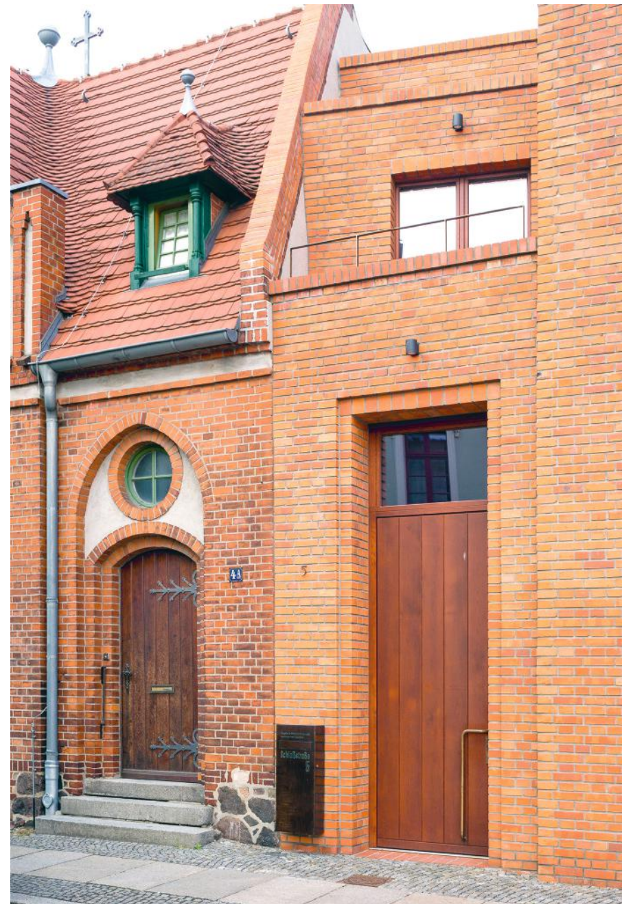
Finsterwalde, Evangelisches Gemeindehaus, Gewinner des Brandenburgischen Baukulturpreises 2017 Planung: HABERMANN Architektur- und Ingenieurgesellschaft mbH

Mittel, die eindeutig und dezidiert im Sinne einer hohen Baukultur verwendet werden, belaufen sich für das Jahr 2019 auf eine Größenordnung von ungefähr 12,5 Millionen Euro. Davon entfallen fast 86 Prozent auf die institutionelle Denkmalpflege, ungefähr zehn Prozent auf das Wettbewerbswesen und etwa vier Prozent auf die allgemeine Beteiligung der Zivilgesellschaft mit dem Ziel einer umfassend informierten und mündigen Öffentlichkeit.