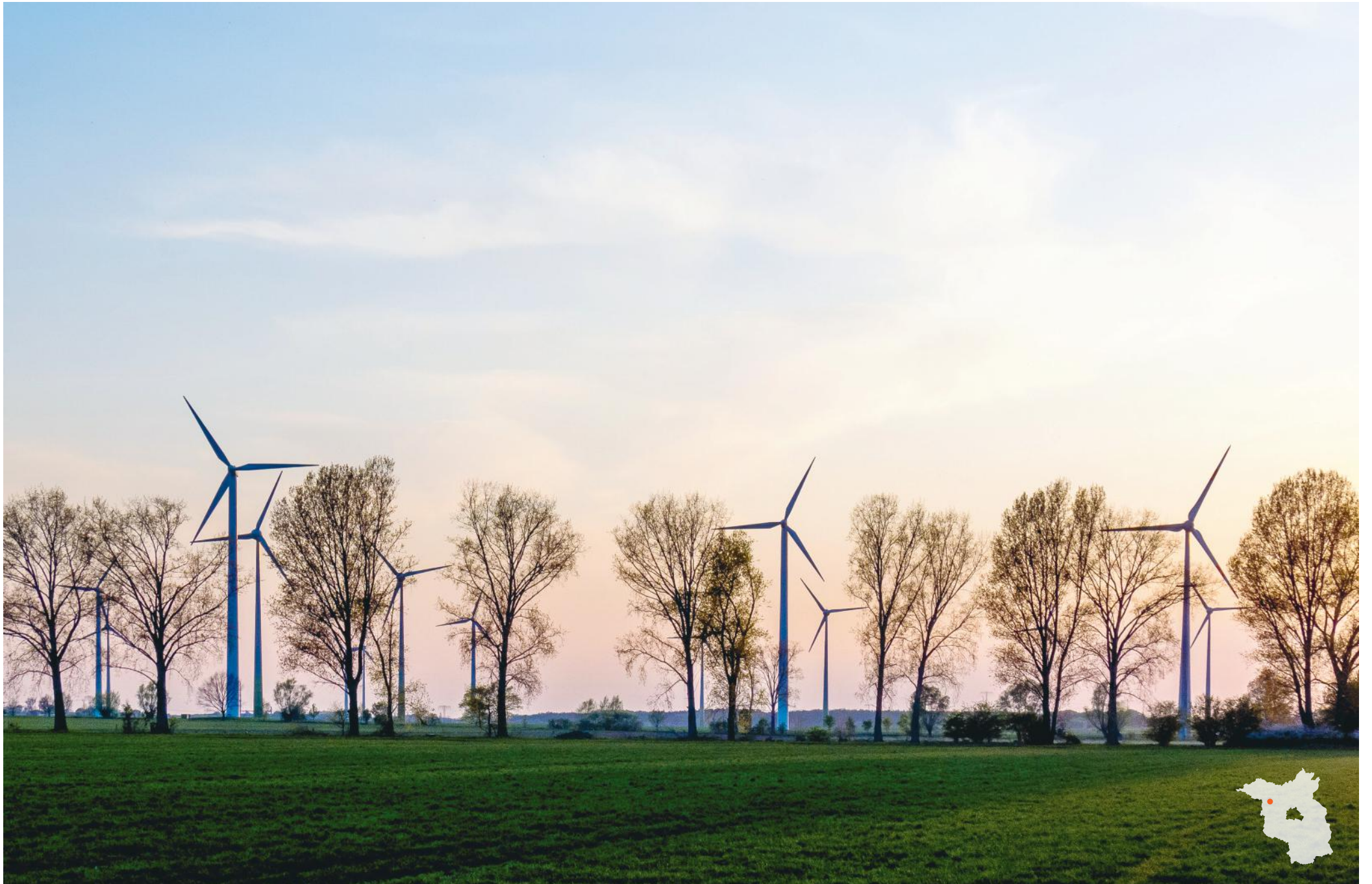
Bei Bückwitz Windkraftanlagen