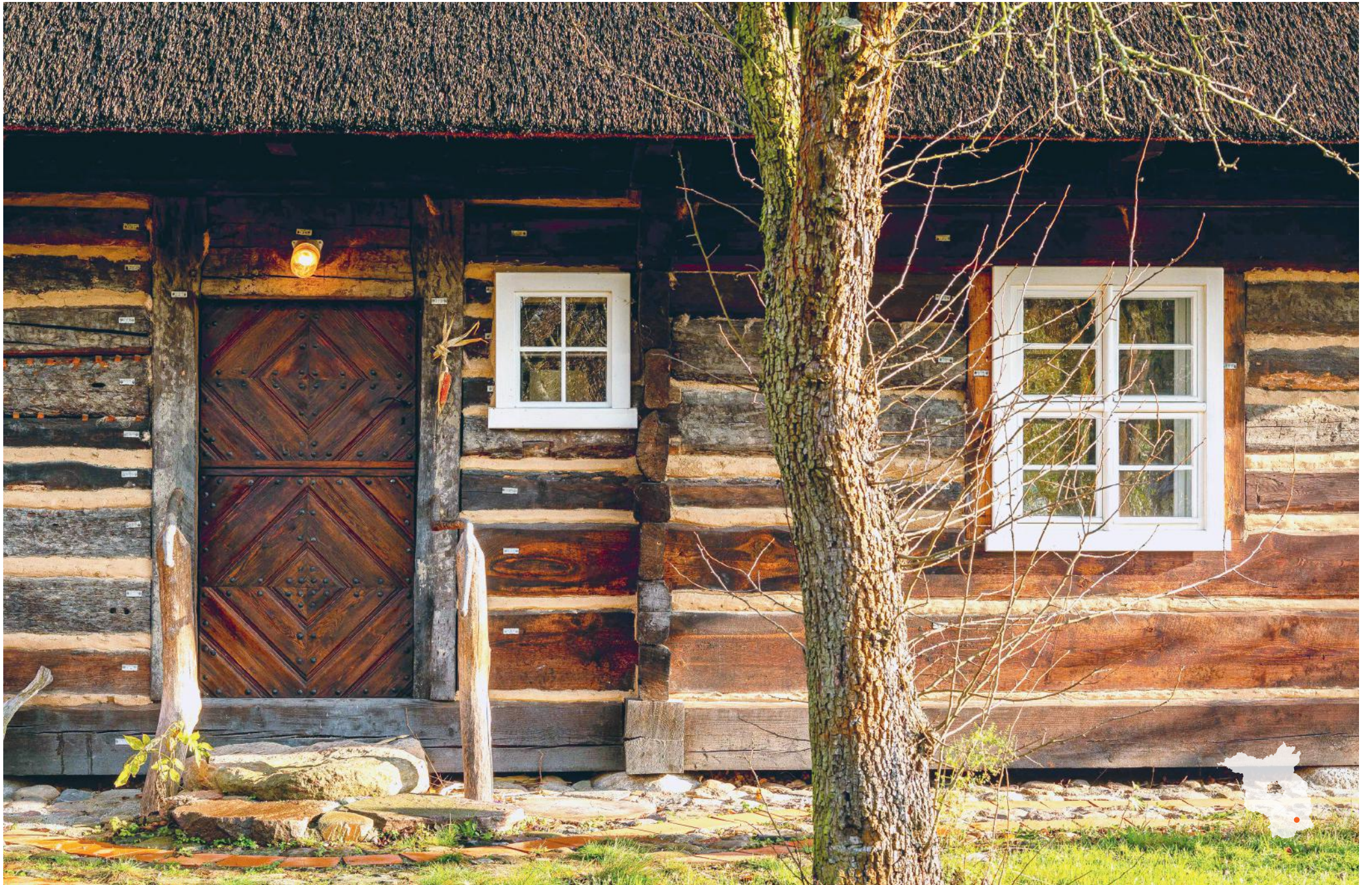
Burg Annemarie-Schulz-Haus (transloziertes Wohnstallhaus von 1726)