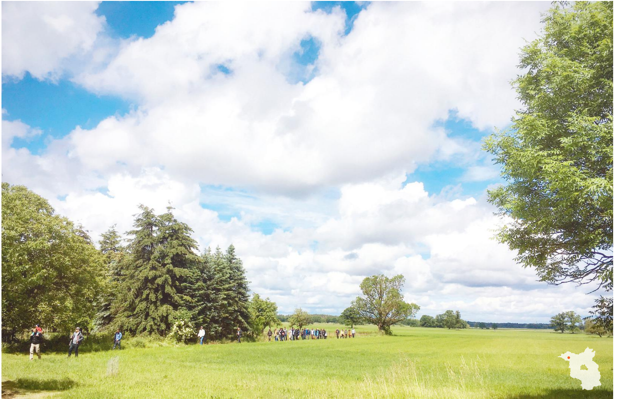
Baukultur Picknick in Nebelin