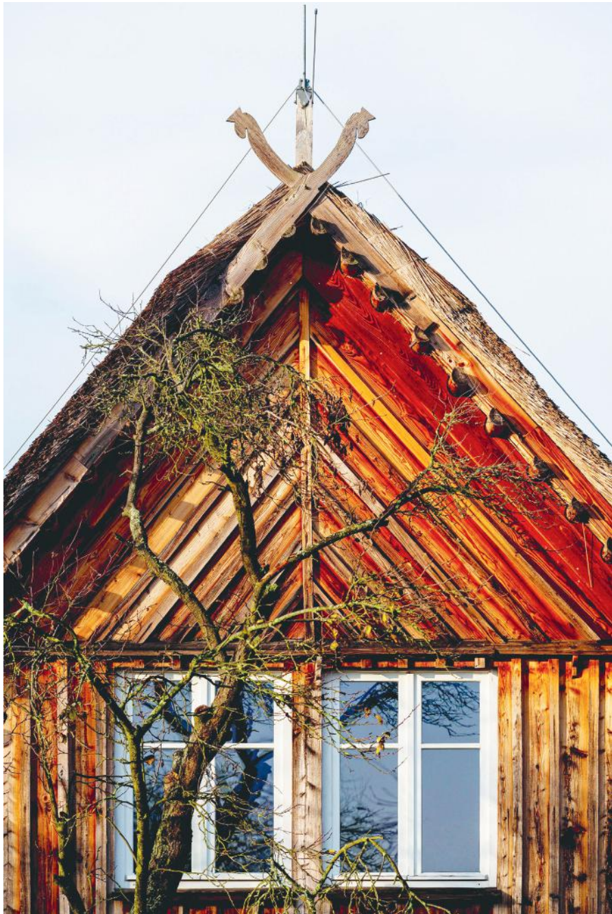
Burg, Spreewald Kräuterey