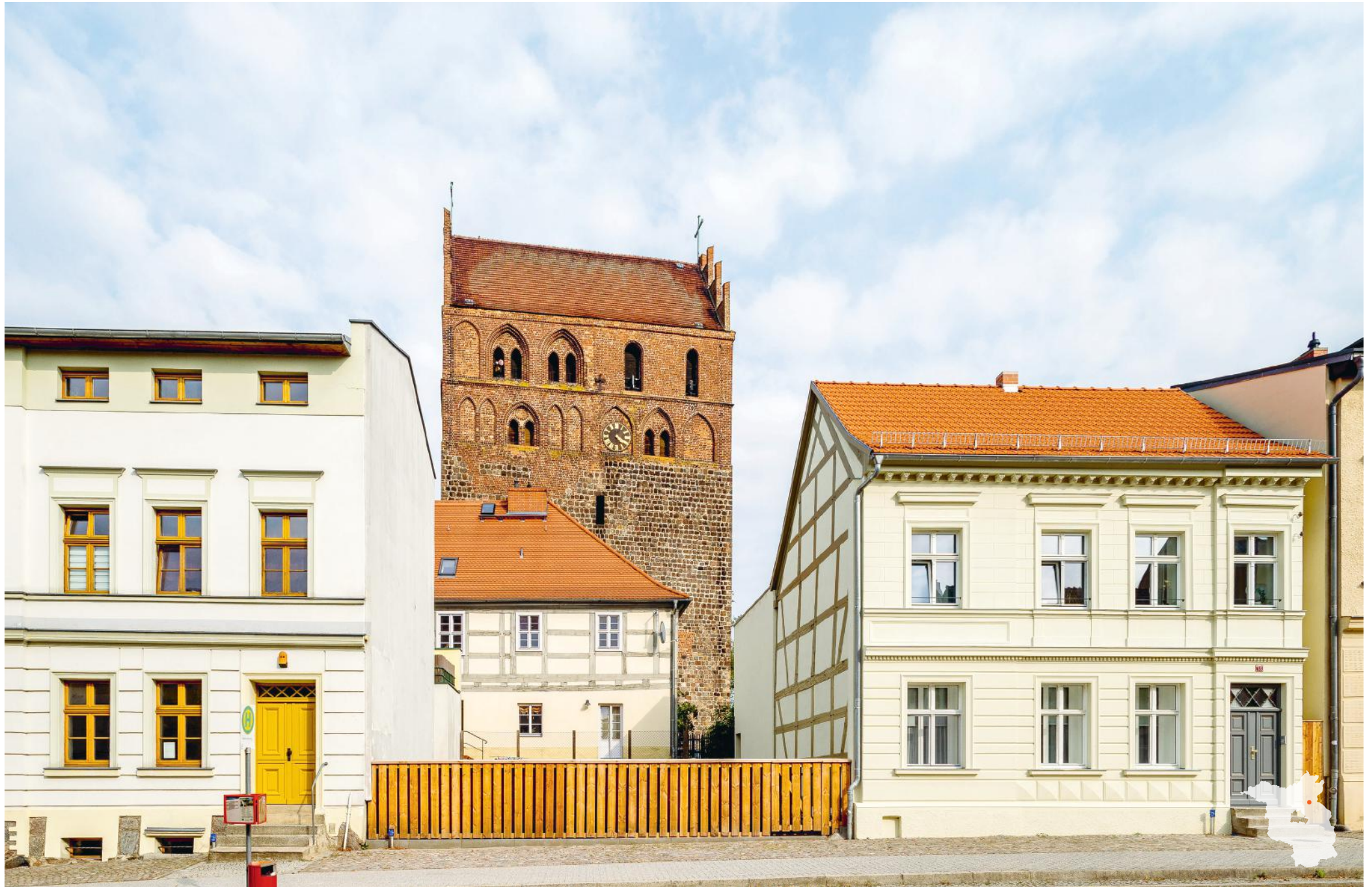
Angermünde Baulücke mit Blick zur Stadtpfarrkirche