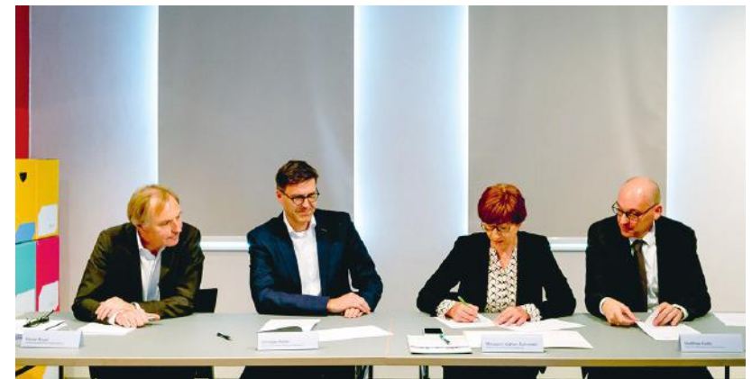
Unterzeichnung der Kooperationsvereinbarung für die Baukulturinitiative Brandenburg am 6. Mai 2019

Initiatoren: Ministerium für Infrastruktur und Landesplanung des Landes Brandenburg (MIL), Brandenburgische Architektenkammer (BA), Brandenburgische Ingenieurkammer (BBIK)