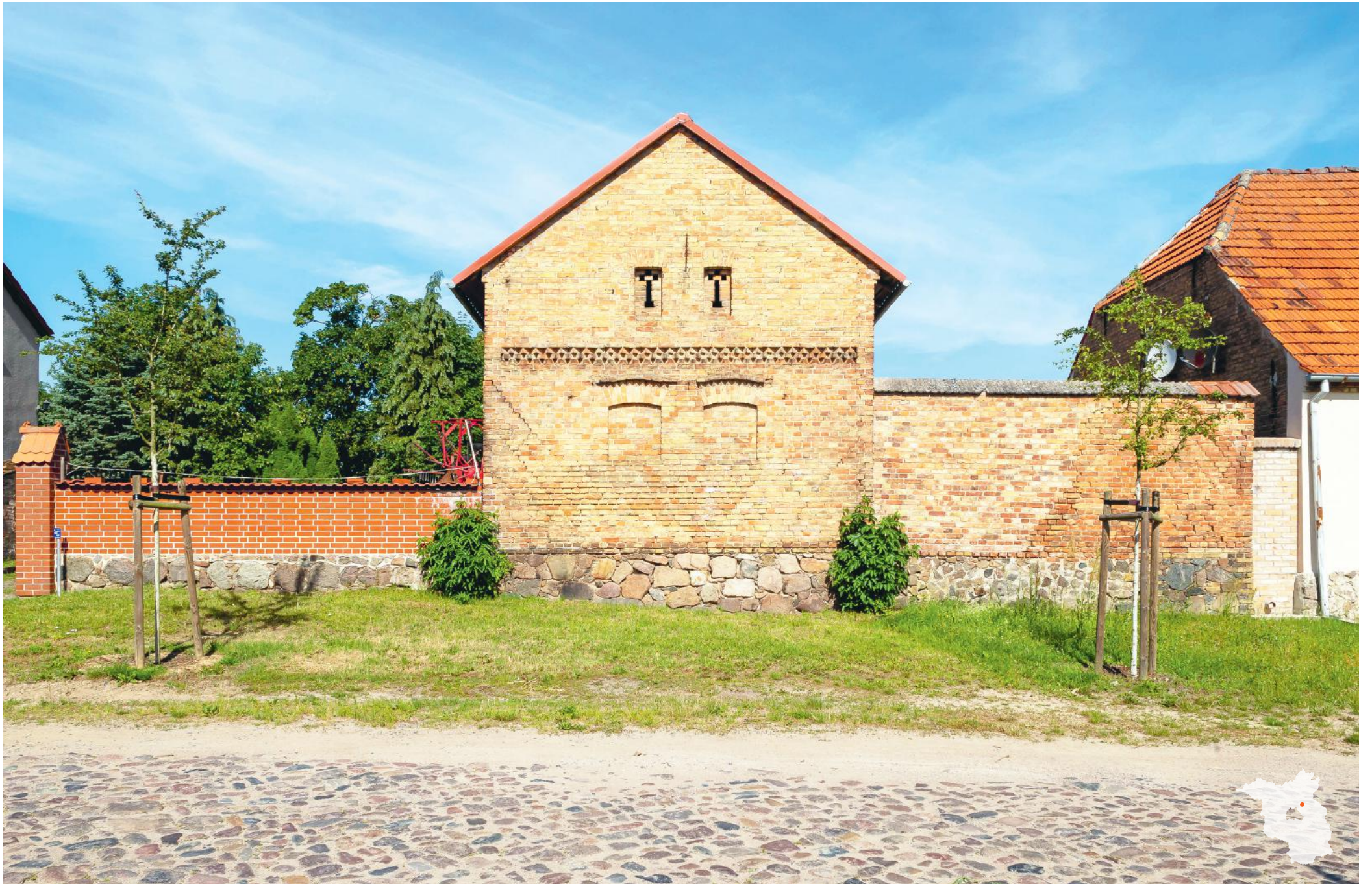
Chorin Choriner Dorfstraße