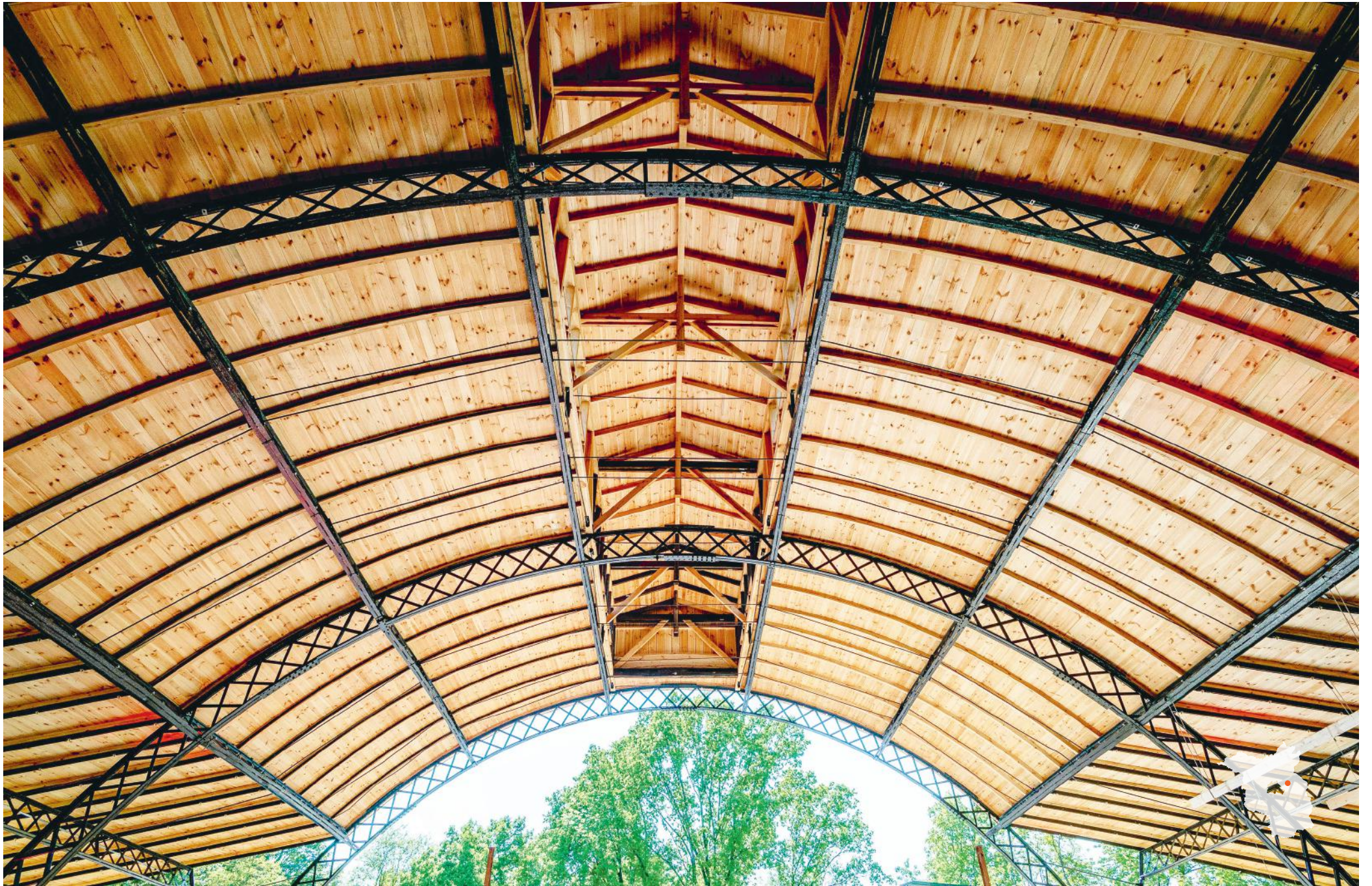
Eberswalde Borsighalle Planung: Dr. Fischer und Co. Bauingenieure GmbH