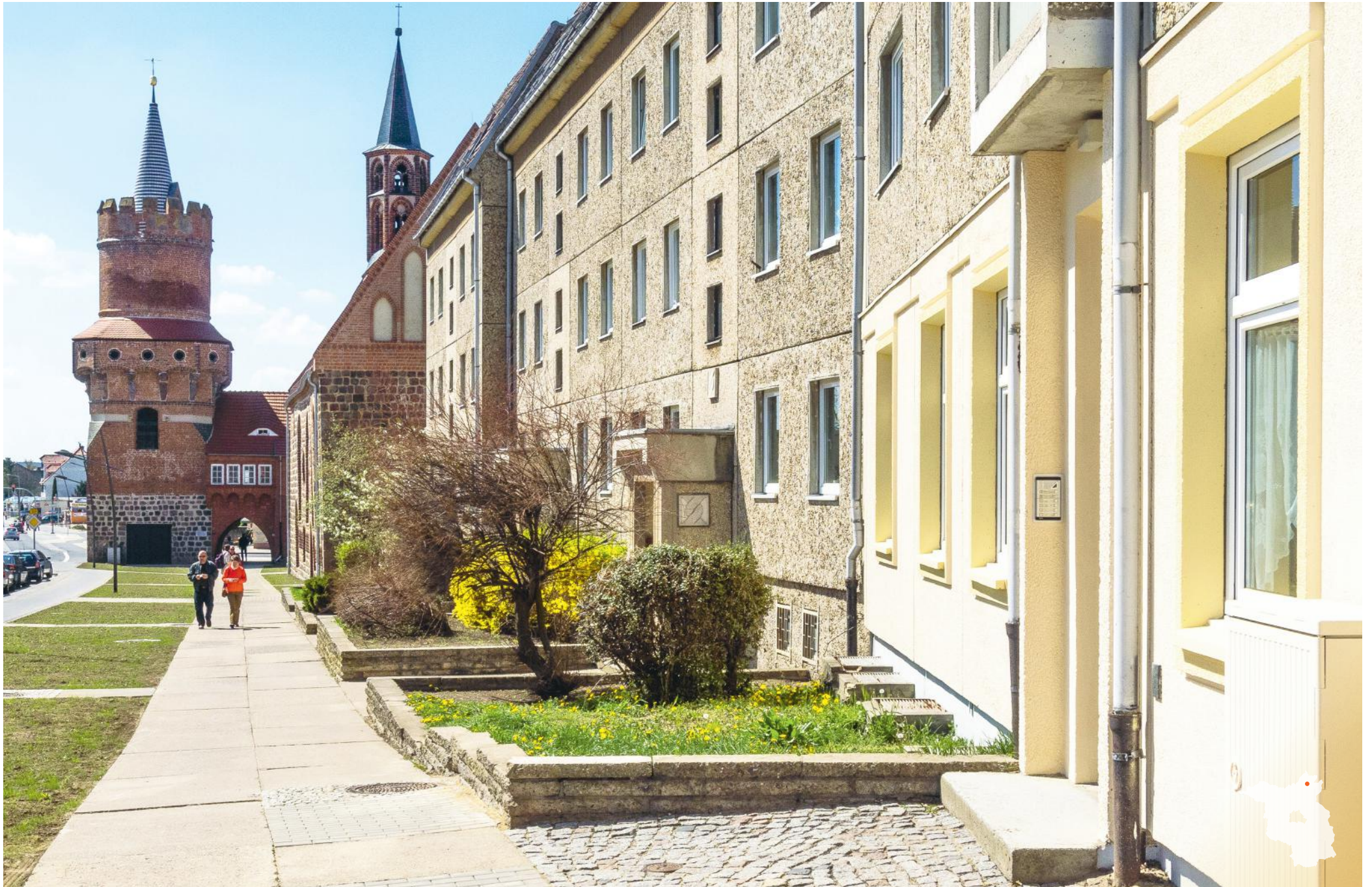
Prenzlau Marktberg mit Mittelorturm und Heiliggeistkapelle