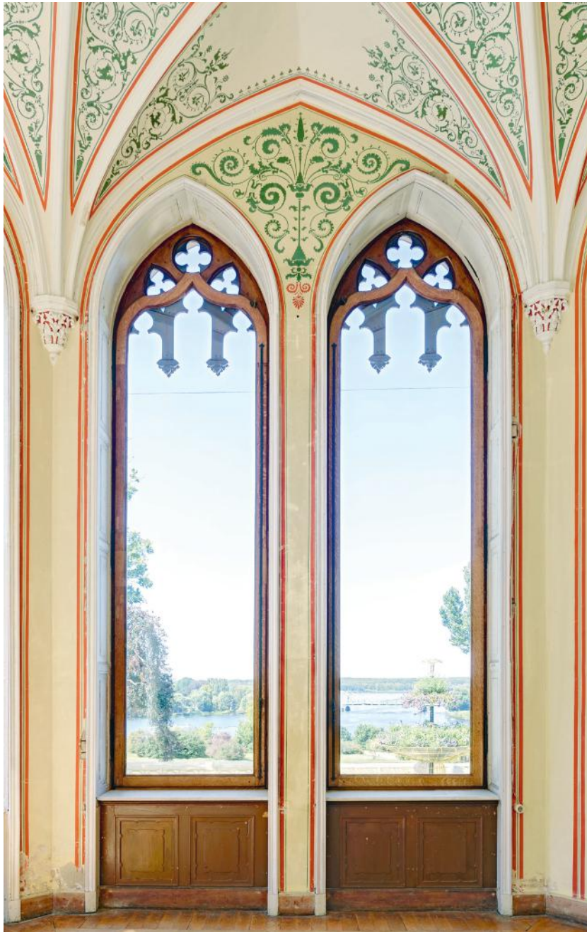
Potsdam, Schloss Babelsberg Planung: Krekeler Architekten Generalplaner GmbH