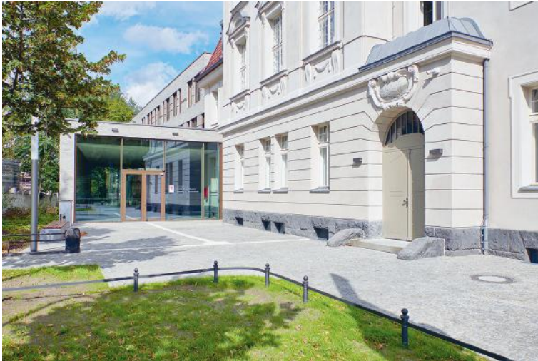
Königs Wusterhausen, Amtsgericht. Gewinner des Brandenburgischen Baukulturpreises 2021 Planung: Abelmann Vielain Pock Architekten Partnerschaft mbB Architekten BDA

Gespräche Baukultur vor Ort ist eine Veranstaltungsreihe, die mit Bezug auf die preisgekrönten Objekte des Baukulturpreises in den Zwischenjahren der Preisverleihung stattfindet. Die im Rahmen dieses Formats thematisierten Gebäude und Anlagen von hoher baukultureller Qualität werden am ihrem jeweiligen Entstehungs- und Wirkungsort öffentlich präsentiert und diskutiert.