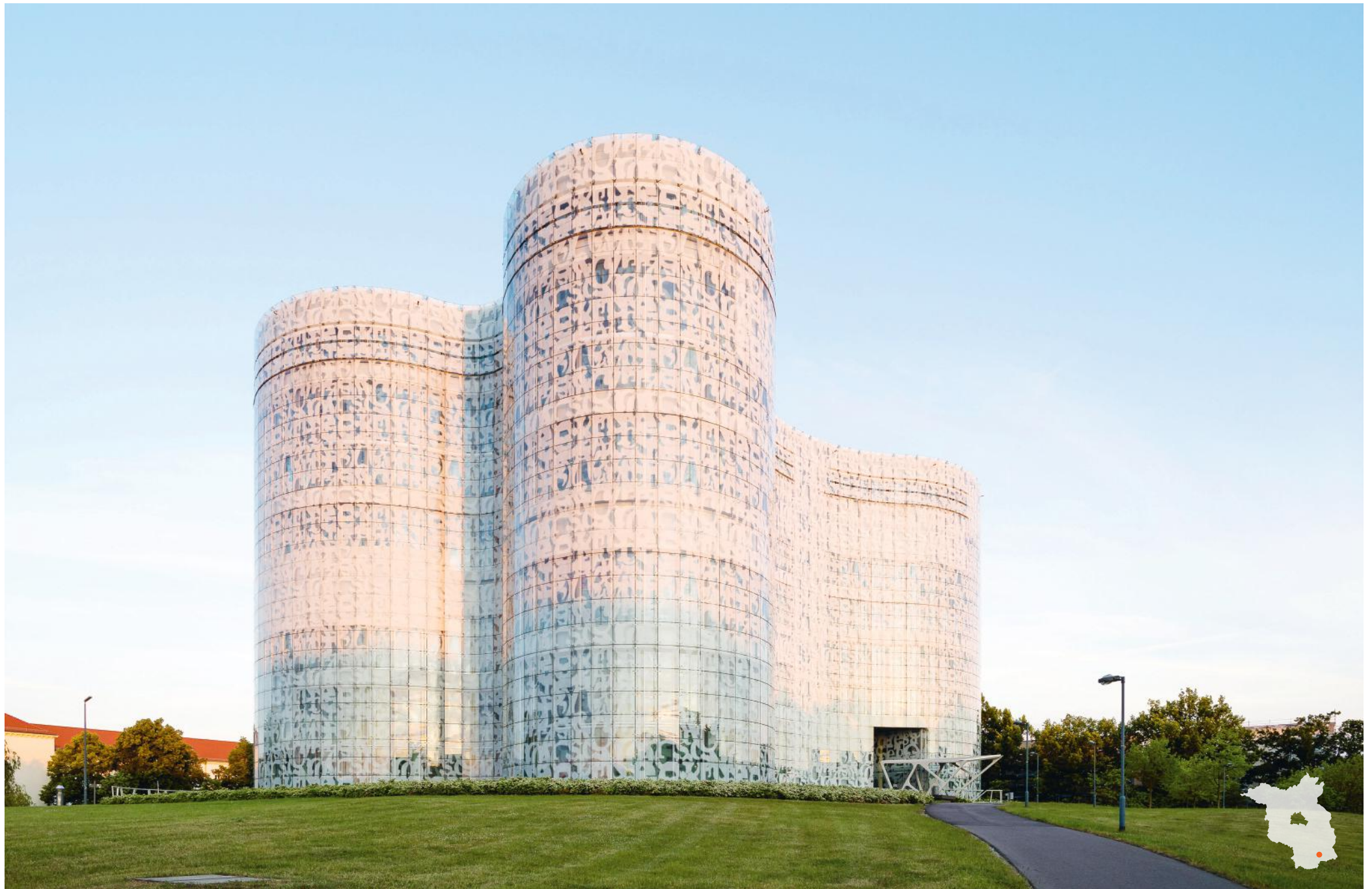
Cottbus Brandenburgische Technische Universität Cottbus-Senftenberg Planung: Herzog & de Meuron, Höhler + Partner Architekten und Ingenieure