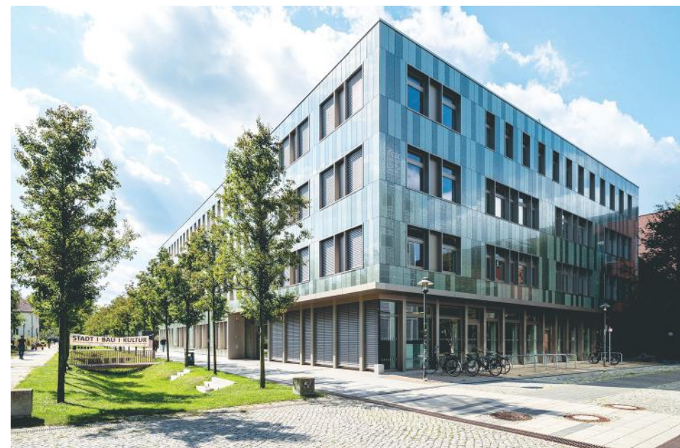
Potsdam, Fachhochschule Potsdam Planung: BRH Generalplaner GmbH

Stattdessen wäre es in diesem Kontext naheliegend, die Rolle von Wettbewerben in Architektur und Ingenieurwesen in den Blick zu nehmen. Obwohl die im Rahmen von Wettbewerben ausgelobten Planungen auf eine zweckgerichtete, bauliche Investition abzielen, sind Wettbewerbsverfahren ein äußerst geeignetes Mittel der Kommunikation zwischen Fachleuten und Laien sowie der frühzeitigen Information und sogar Einbindung der Öffentlichkeit. Abgesehen davon gelten Planungswettbewerbe nach wie vor als bewährtes Instrument einer hohen Baukultur. Sie sichern hohe Entwurfsqualität, Funktionalität und individuelle Gestaltung, somit essentielle Faktoren guter Architektur, und tragen durch die