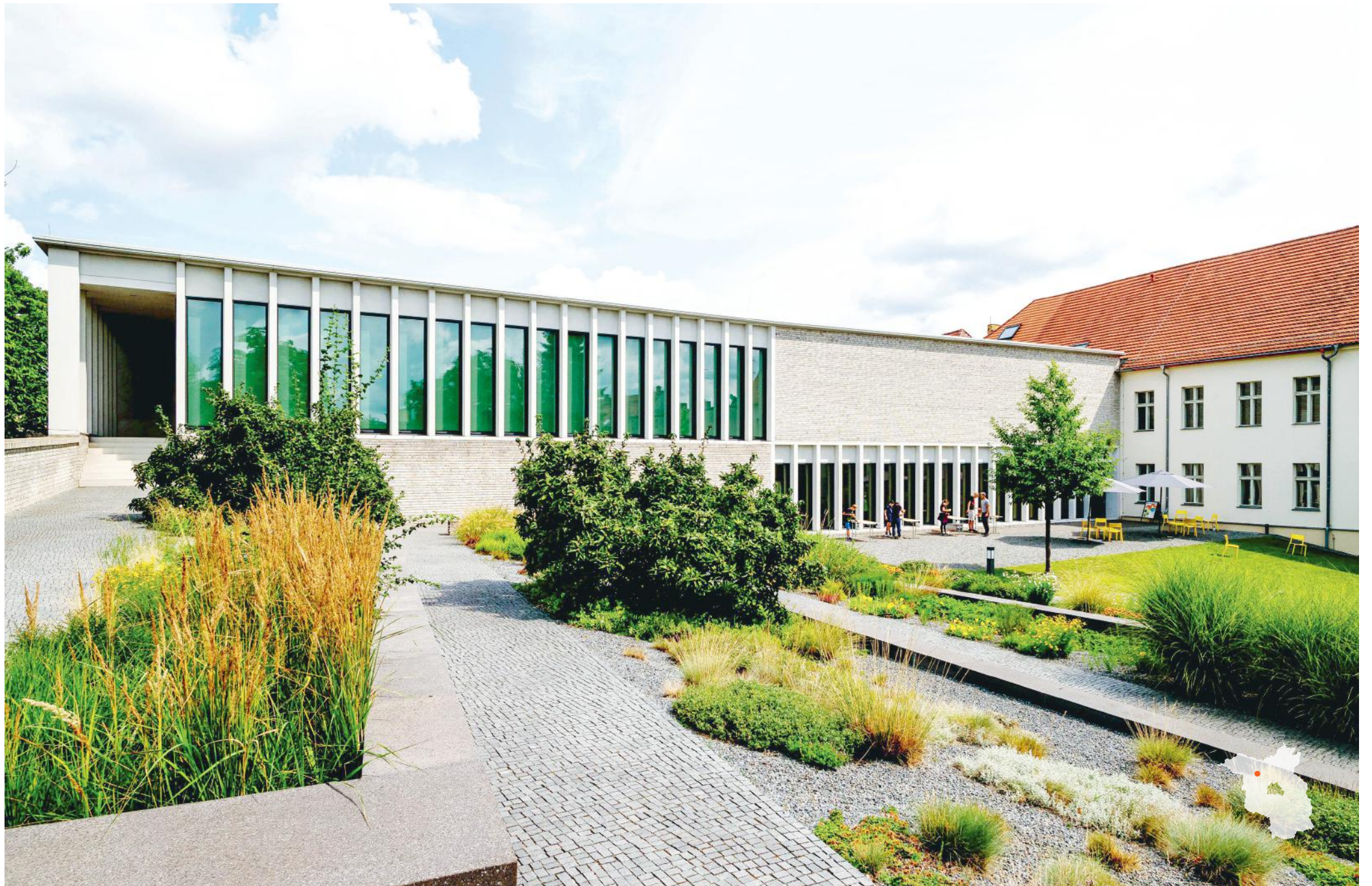
Neuruppin Museum Neuruppin Planung: Springer Architekten GmbH