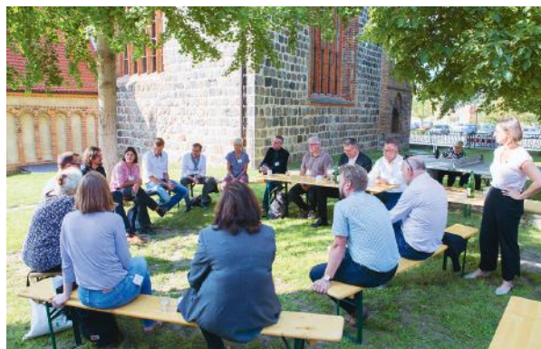
Tagung Dorfkirchen in Prenzlau am 10. September 2021

Dieser Gedanke leitet auch die Arbeit der Baukulturinitiative Brandenburg und des Fördervereins Baukultur Brandenburg. Im Bewusstsein, dass die Initiator:innen lediglich mittelbaren Einfluss auf die Planungs- und Bautätigkeiten im Land Brandenburg nehmen können, ist die Förderung einer Gesprächskultur im Land umso wichtiger. Es gilt, dem Anspruch einer hohen Baukultur auch auf der Ebene des gesellschaftlichen Miteinanders gerecht zu werden. Aus dieser Perspektive wächst den Instrumenten der Vermittlung, der Beteiligung sowie dem fachlichen und sachlichen Diskurs eine besondere Bedeutung zu, auch und besonders im Hinblick auf die Fördermaßnahmen.