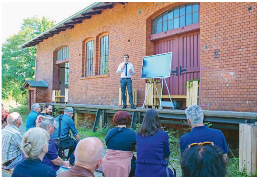
Baukultur Picknick in Wiesenburg am 3. September 2021

Mit nachhaltigem und verantwortungsvollem Bauen wird das Land den naturräumlichen und ökologischen Belangen in den drei Brandenburger UNESCO-Biosphärenreservaten gerecht. Die zuständigen Ministerien unterstützen die lokalen und regionalen Baukulturschaffenden, sodass die von langer Siedlungstradition und reicher Baukultur geprägten Kulturlandschaften Brandenburgs geschützt und weiterentwickelt werden.