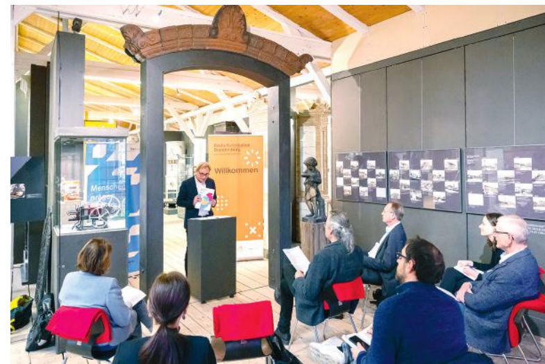
Übergabe des Veltener Fünf-Punkte-Plans am 9. November 2021

Seit der Startphase im Jahr 2019 unterstützt und begleitet die Bundesstiftung Baukultur die baukulturellen Aktivitäten der Baukulturinitiative Brandenburg. Dank dieses Zusammenwirkens ist die Baukulturinitiative in der Lage, ihre Arbeit zu verstetigen und auszuweiten. Mit gemeinsamen Veranstaltungen können nicht nur Fachleute, sondern auch private Initiativen und die breite Öffentlichkeit erreicht und für die Anliegen einer hochwertigen Baukultur im Land sensibilisiert werden. Gleichzeitig eröffnen die Aktivitäten der Bundesstiftung der Baukulturinitiative die Möglichkeit, über