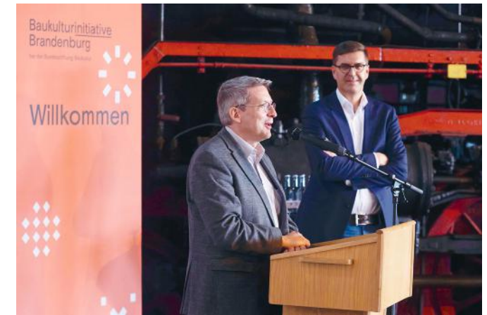
Baukultur im Ort in Wittenberge am 25. September 2020