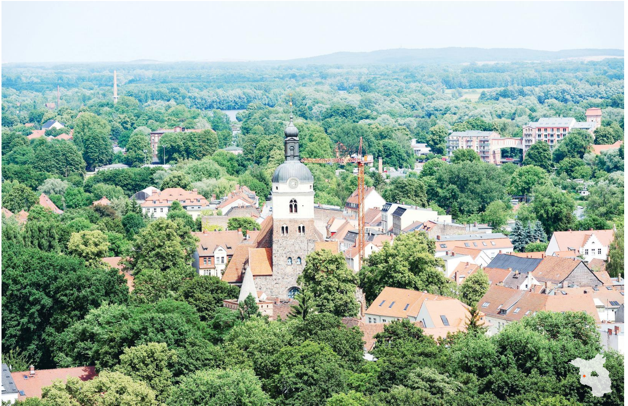
Brandenburg an der Havel Blick auf die St.-Gotthard Kirche